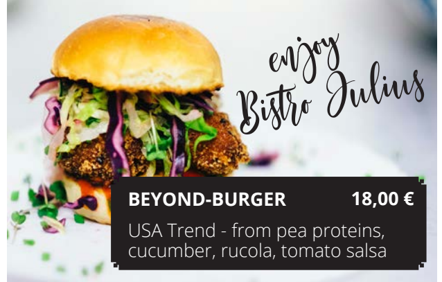
BEYOND-BURGER 18,00 €

USA Trend - from pea proteins, cucumber, rucola, tomato salsa