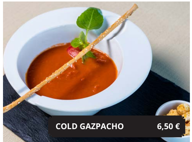
COLD GAZPACHO 6,50 €

USA Trend - from pea proteins, cucumber, rucola, tomato salsa